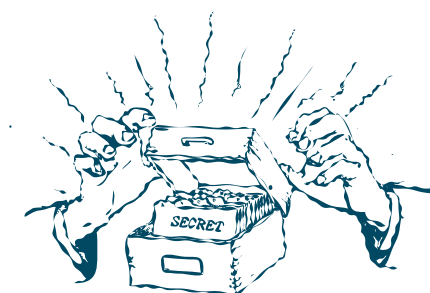
fig. 19: la Scatola.