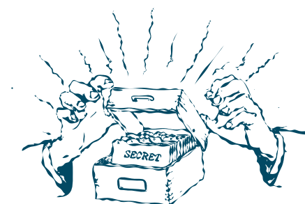
fig. 19: la Scatola.