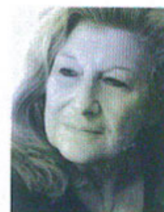
di Mariella Morosi