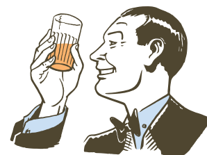
Fig. 15 - Alla salute.